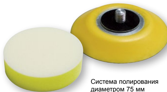
Система полирования диаметром 75 мм с «липучкой» для губки и сукна